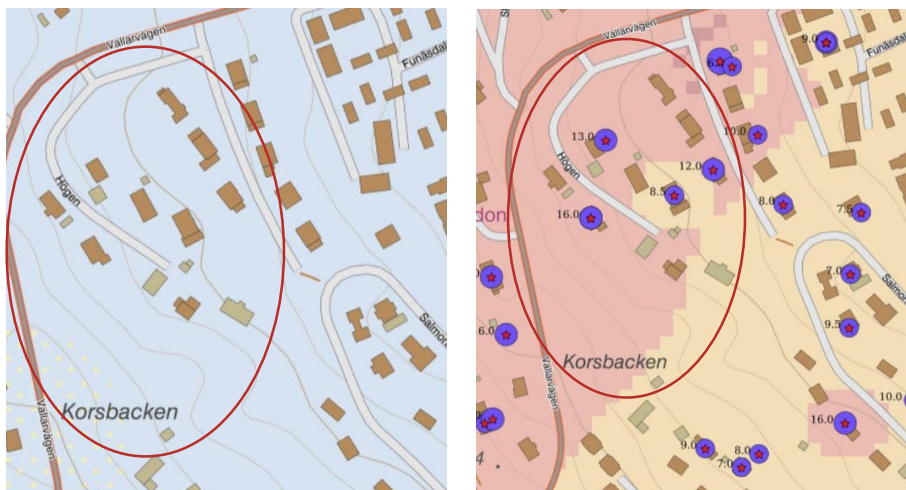
Bild 4:1 Jordartskarta visar morän i området. Markerat med röd ring. Bild 4:2 Jorrdjupskarta visar jorddjup i utförda brunnborrningar. Markerat med röd ring (SGU 2023).

Djup till berg bedöms enligt SGU:s jorrdjupskarta vara mellan 5–20 m.