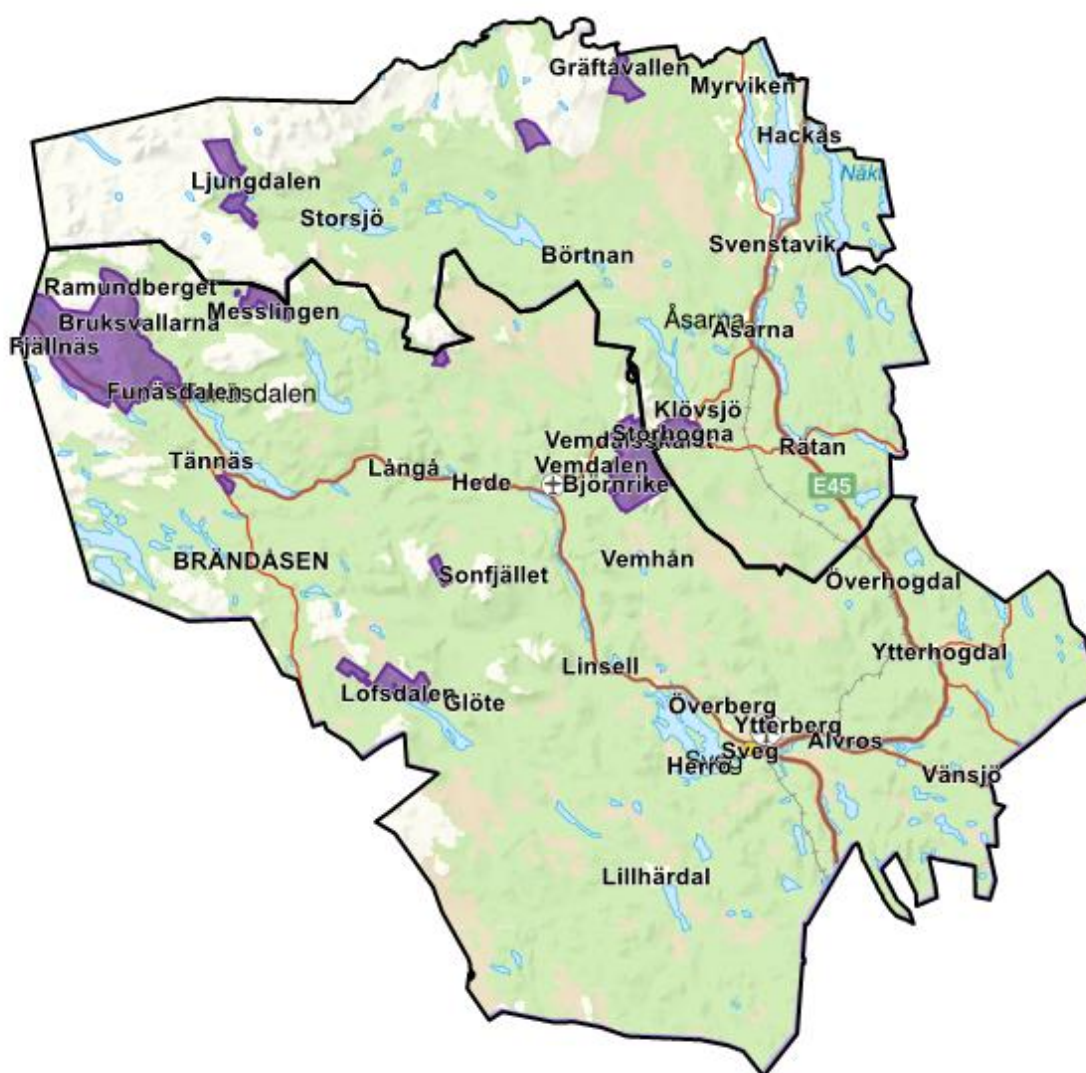
Fig. 1. Hämtområde 2 markerat med lila. Hämtområde 1 är övriga delar av kommunerna.

Fastighet med flerfamiljshus, fler än 5 lägenheter, samt verksamheter ska ha enskilda behållare.