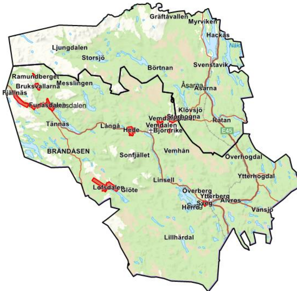
Fig. 2. Teknikområde krantömning markerat med rött.

Tömning med kran erbjuds endast inom rödmarkerade områden, se fig 2.